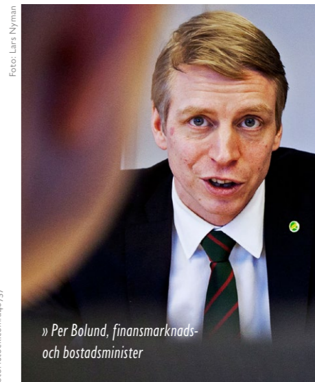
» Per Bolund, finansmarknads- och bostadsminister