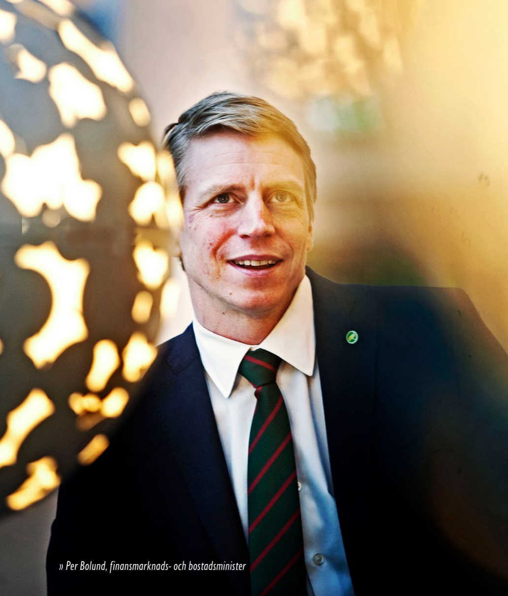
» Per Bolund, finansmarknads- och bostadsminister